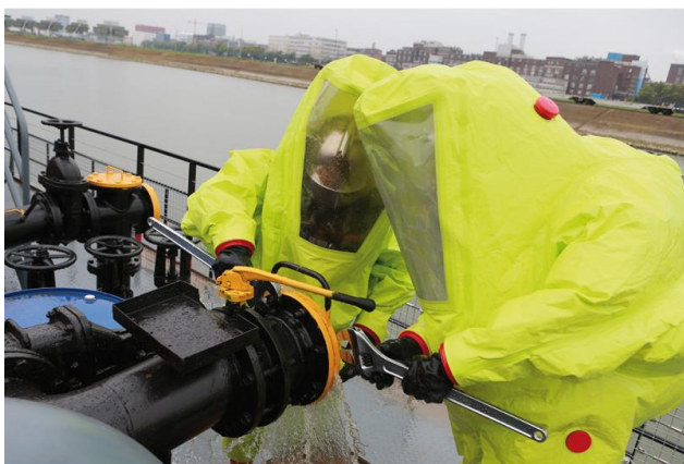
Risque chimique Chemische Risiken