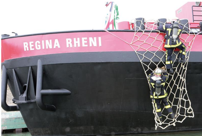
Abordage du navire depuis le fleuve Aufsteigen auf das Schiff durch die Wasserstrasse