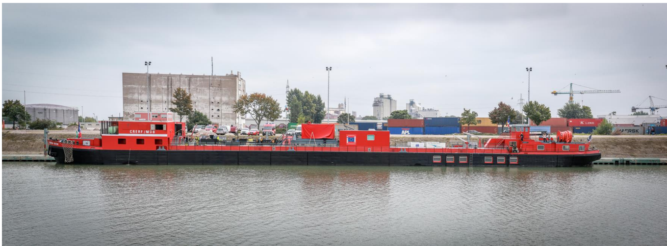
Septembre 2014 – La péniche support du CRERF transformée / September 2014 – umgebautes Übungsschiff