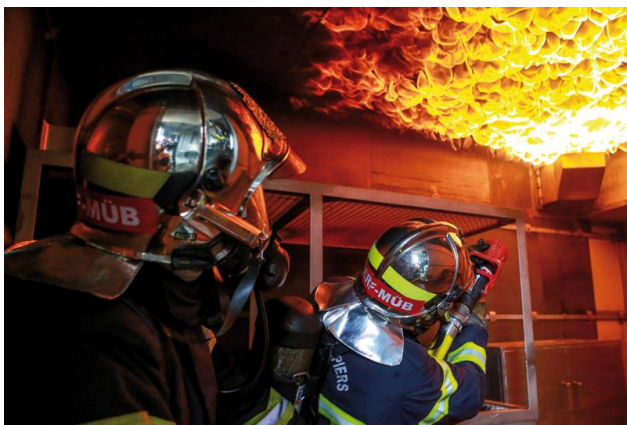
Maison à feux gaz Gasbefeuerte Brandübungsanlage