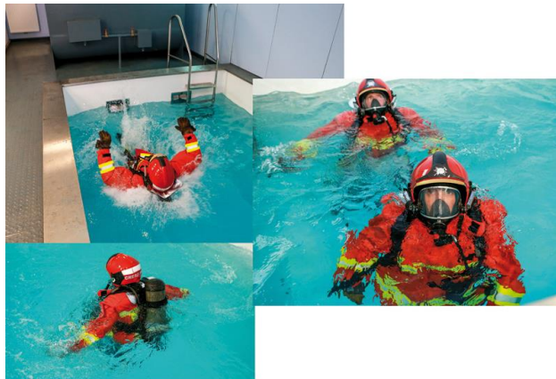
Bassin de tombée à l'eau Wasserübungsbecken